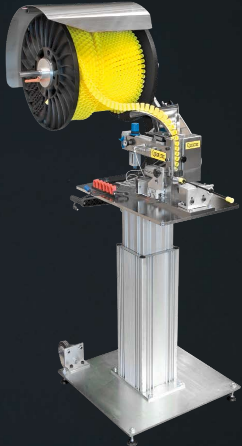
Komplett capsmaskin med pelare och dammskydd