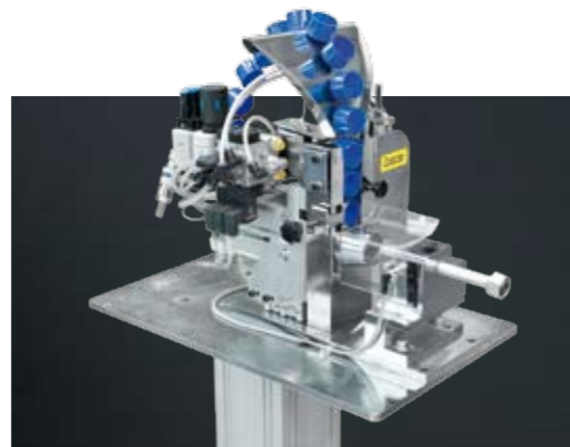
Capsmaskin för hydraulrör