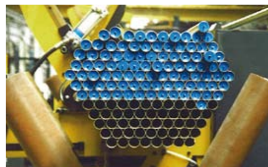
Färdigpluggade rör hos kund