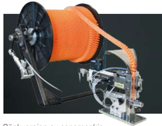
Bänkversion av capsmaskin